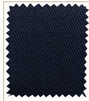
9318 AZUL OSCURO