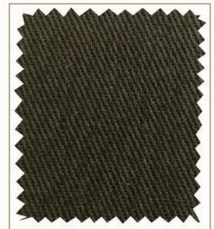
9438 VERDE MILITAR